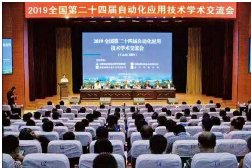
图 2 2019 全国第二十四届自动化应用技术学术交流会大会现场

“2020 第二十五届自动化应用技术学术交流会”的成功召开，恰逢收官“十三五”，谋划“十四五”的关键时期。会议落实了党的十九届五中全会关于贯彻创新、协调、绿色、开放、共享的新发展理念，并为分享智能化研究成果，交智能