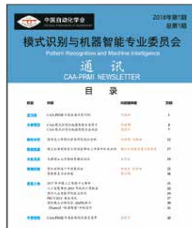
图3 第一期简报封面

2017年11月25日，中国自动化学会模式识别与机器智能专业委员会工作会议在中科院自动化所召开。专委会决定成立五个工作部（发展部、学术部、宣传部、简报编辑部、外联部）。会后，简报编辑部积极开展工作。