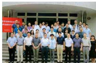
图1 2018专委会换届大会

2018年6月22—23日，由专委会组织召开的“集成自动化国际学术会议”成功举办，会议汇聚国内外著名高校及科研院所大批学者，有来自中国、美国、