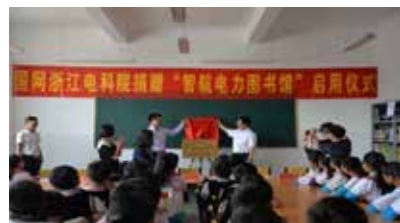
图 2 电力智航图书馆启动仪式

一年又一年，风风雨雨，一日又一日，日落日起。未来路任重道远，专委会将全面谋划发展的新思路、新措施，增强攻坚克难的勇气决心，不断开拓新的业绩和提高工作质量和水平，积极服务电力行业自动化专业，助推行业科学化、智能化技术的繁荣和发展。○