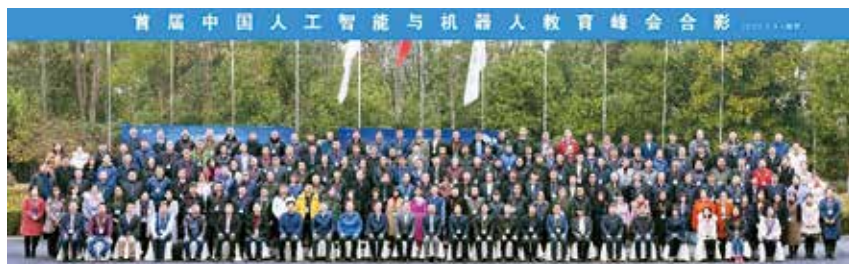
图1 首届人工智能与机器人教育峰会

2019年8月30日，“中国自动化学会人工智能与机器人教育专业委员会成立大会”在广州湛江召开。中国自动化学会副理事长王成红等领导专家出席会议。本次会议汇聚了来自浙江大学、