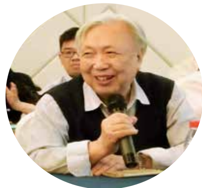
图2 吴宏鑫院士在换届大会上发言

合为服务宗旨，已成功举办14届“中国智能自动化大会（CIAC）”。大会旨在为国内外智能自动化领域的研究者提供一个面对面交流的平台。来自高等院校、科研院所和产业部门的专家、学者和技术人员，汇聚于此平台，深入交流学术思想，探讨技术问题，增进彼此了解、友谊与合作。