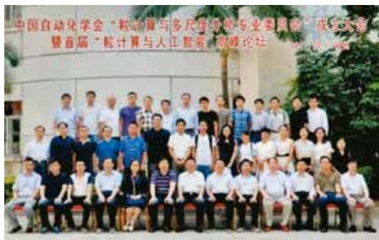
图1 部分与会人员合影留念

系统研讨会暨粒计算与多尺度分析专业委员会学术年会”。会议线上线下同步进行，来自中国科学院自动化研究所、北京交通大学、北京理工大学、香港城市大学、河南工业大学、集美大学、国防科技大学、湖南大学、长沙理工大学和湖南师范大学的近百位专家和研究生参加了此次会议。○