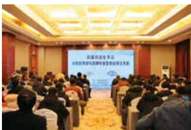
图1 专委会成立大会

2019年1月5日，中国自动化学会分数阶系统与控制专业委员会成立大会在合肥召开。来自全国各地的百余位专家学者出席大会，共同见证了专委会的诞生。专委会将贯彻党和国家“科教兴国、人才强国”的方针大略，响应总书记“为建设世界科技强国而奋斗”的号召，齐心协力，有效汇聚各方智慧和力量，一如既往地在国内分数阶系统与控制领域的专家学者们提供一个展示成果、合作交