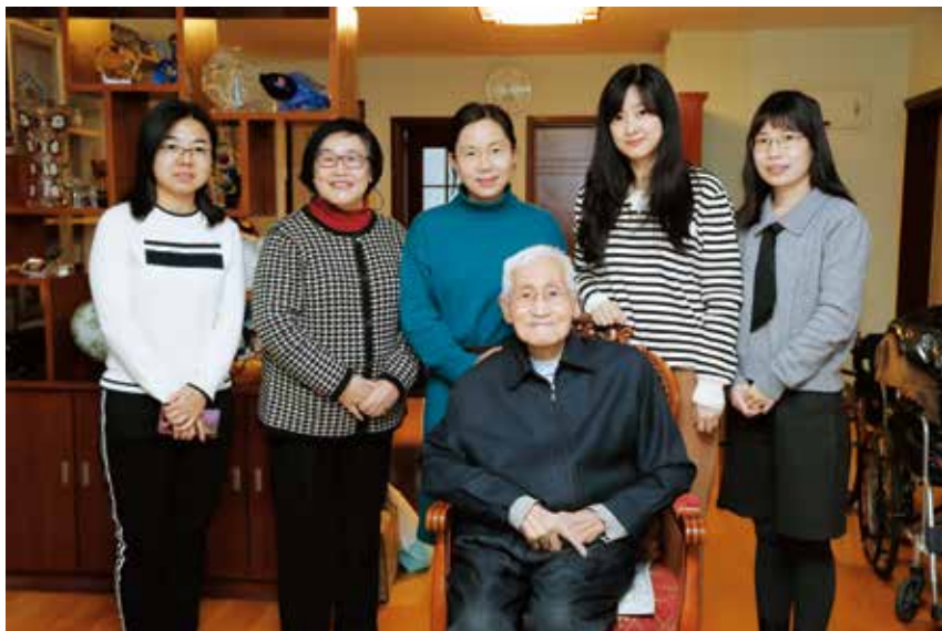
图3 2021年陆元九院士接受学会秘书处采访

阴痛心不已，但对挨批斗、蹲牛棚的日子，却只是一笑置之。因此，粉碎“四人帮”之后，陆元九深切表示希望继续从事惯性导航研究工作，争取把“文革”中失去的时间尽可能补回来。在担任北京控制器件研究所所长期间，陆元九积极参加航天型号方案的论证工作，并一直倡导跟踪世界尖端技术。在他的领导下，国家批准建立了惯性仪表测试中心，为我国惯性仪表研制创立了坚实基础。陆元九还充分利用对外开放的机会，多渠道聘请专家，组织国际会议，进行技术交流，引进人才，促进了我国惯性技术的发展。