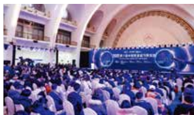
图2 开幕式及主论坛现场

2020年12月5日，“2020（第六届）中国智慧城市博览会”在北京展览馆圆满落幕。本届智博会以“人民的城市——融合生