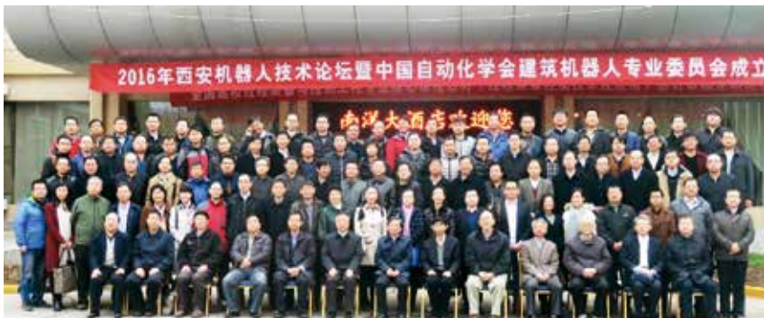
图1 中国建筑机器人技术论坛合影

专委会自成立以来成功组织召开10余次秘书组会议，商讨专委会日常管理、学会对接、新委员遴选、会议组织、项目建议等重要事宜，并连续组织四届“全国建筑机器人技术论坛（中国建筑机器人技术大会）”（2016—2019），论坛影响力日益增大，已成为国内建筑机器人领域的权威会议。