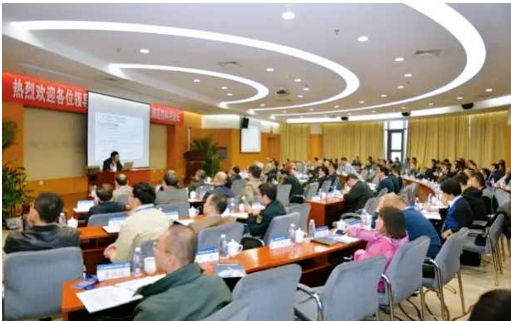
图2 2017中国遥测遥控科技论坛