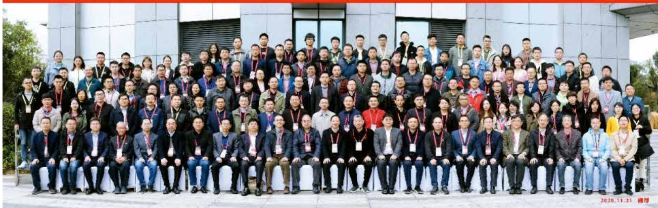
图 2 第 5 届“无人飞行器自主控制前沿论坛”

学者分别对无人机建模和架构、自主控制、智能感知、集群协同控制等重大问题进行了深入讨论，研讨过程中大家讨论热烈，气氛活跃。