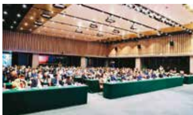
图1 2021年自动驾驶商业应用大会

2021年4月8日，由工委参与组织的“2021自动驾驶商业应用大会”在四川省成都市成功举办。