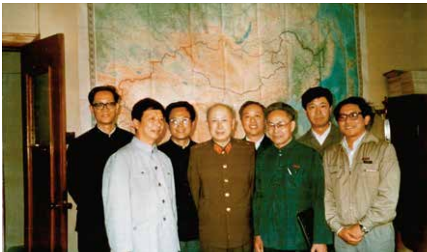
图2 1985年由王仁院士率领拜访钱学森先生 前排左起黄琳、钱学森、王仁、余同希，后排左起魏庆鼎、武际可、周起釗、叶庆凯

任教，母亲则带着他和哥哥留在扬州。父亲也只能在寒暑假冒着风险，带着家用回来住十天半月。