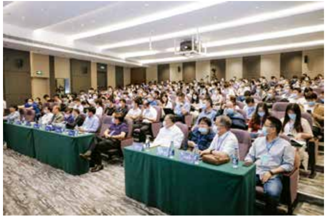
图2 IEEE 第十届数据驱动控制与学习系统会议 (DDCLS' 21)

和交流平台。在大数据时代的背景下，本次大会为推动我国在数据驱动控制、学习与优化领域的研究以及提升我国在该研究领域的学术地位作出重要的贡献，并有力地推动了自动化学科的发展和国民经济的发展。