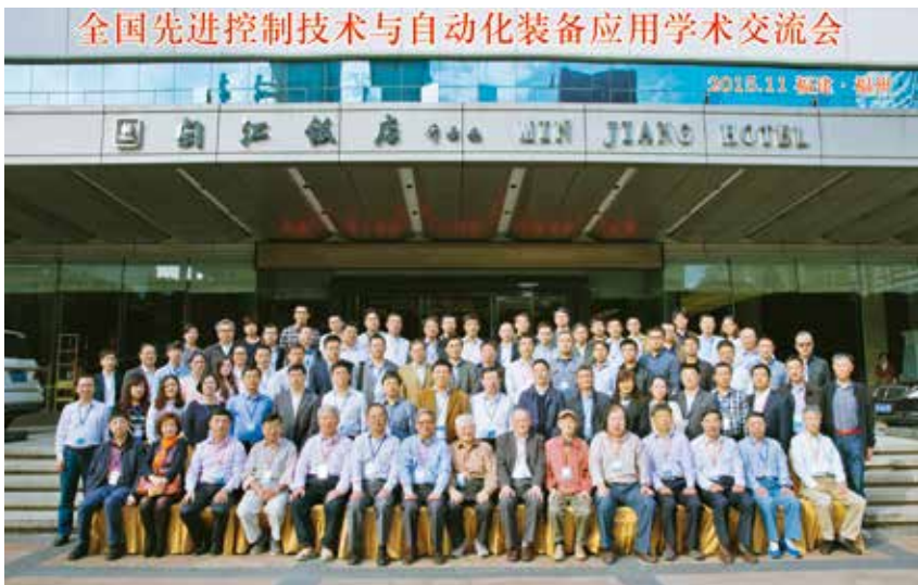
图1 2015全国先进控制技术与自动化装备应用学术交流

由专委会主办的“2019中国智能控制与自动化装备学术会议”于10月25—26日在西安工业大学成功举行，来自全国高校、企