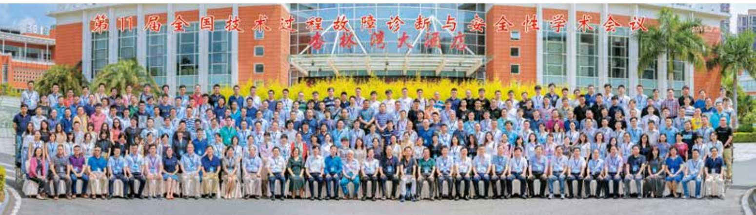
图2 厦门学术会议合影