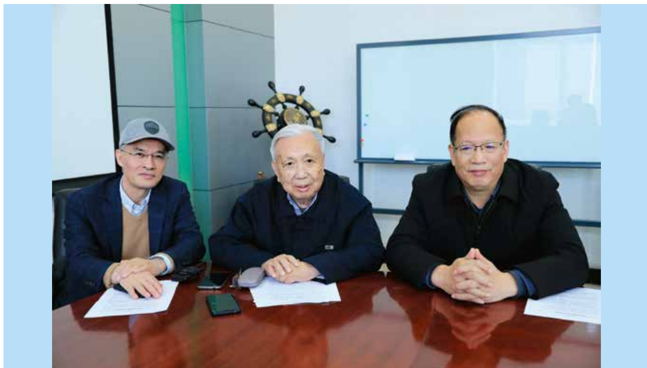
图1 吴宏鑫院士接受学会秘书处采访（左：王飞跃 右：王成红）

动控制系。2003 年当选为中国科学院院士。获得了多项研究成果，其中获国家发明三等奖和二等奖各 1 项，部级科技进步一等奖 1 项、二等奖 5 项，全国优秀科技图书二等奖 1 项，获国家发明专利多项。