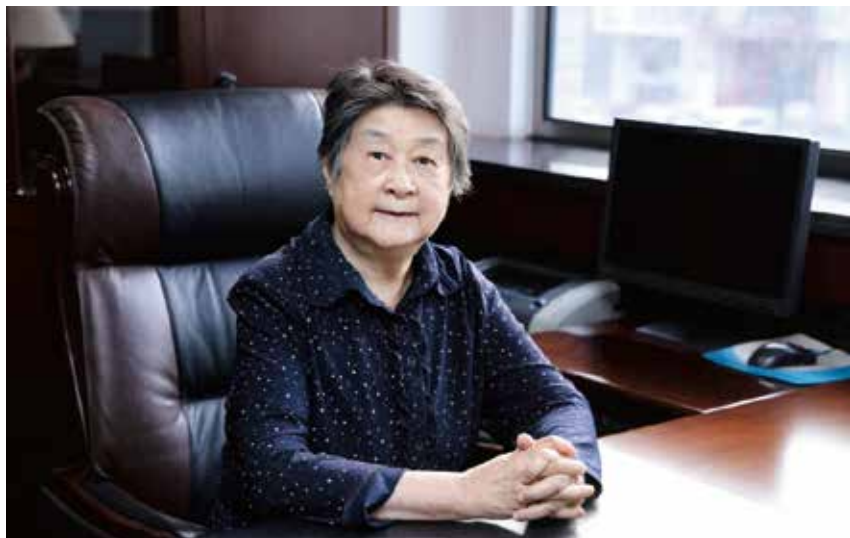
图2 胡启恒院士回顾求学及科研经历

国互联网民营企业的勇于创新，蓬勃发展，特别是政府在推动互联网健康发展和治理的过程中作出的各项努力，制定的各项规章制度。”