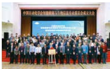
图1 专委会成立大会

“自动世界、自动未来”，值此中国自动化学会六十华诞之际，中国自动化学会智能健康与生物信息专业委员会祝学会事业不断发展壮大，为我国的社会主义现代化建设贡献更大的力量。