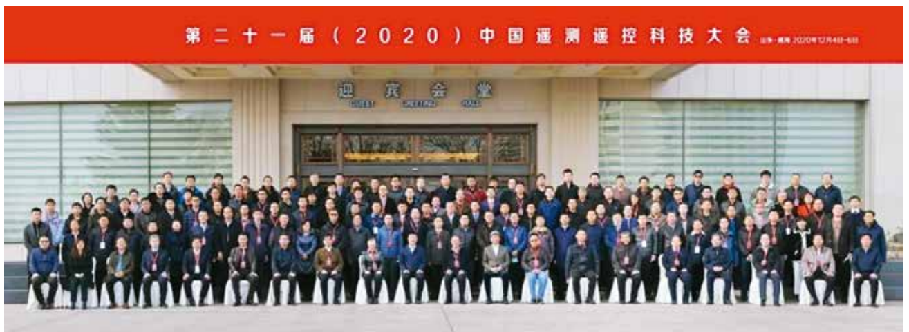
图1 第二十一届（2020）中国遥测遥控科技大会

2020年12月4—6日，由中国自动化学会遥测遥感遥控专业委员会、中国宇航学会遥测专业委员会、中国航天科技集团有限公司科技委航天遥测遥控技术专业组、北京遥测技术研究所联合