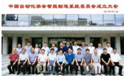
图1 中国自动化学会智能制造系统专业委员会成立大会

2017年7月14日，“中国自动化学会智能制造系统专业委员会成立大会”在中国科学院自动化研究所召开。会议通过了第一届专委会组成人员名单，介绍了成立专委会的背景和前期筹备工作、专委会成立后的工作布局等，各专家委员对专委会工作建言献策，通过专题报告的形式进行了学术交流，同时，与会人员还参观了自动化所各项最新研究成果。至此，中国自动化学会智能制造系统专业委员会正式成立！