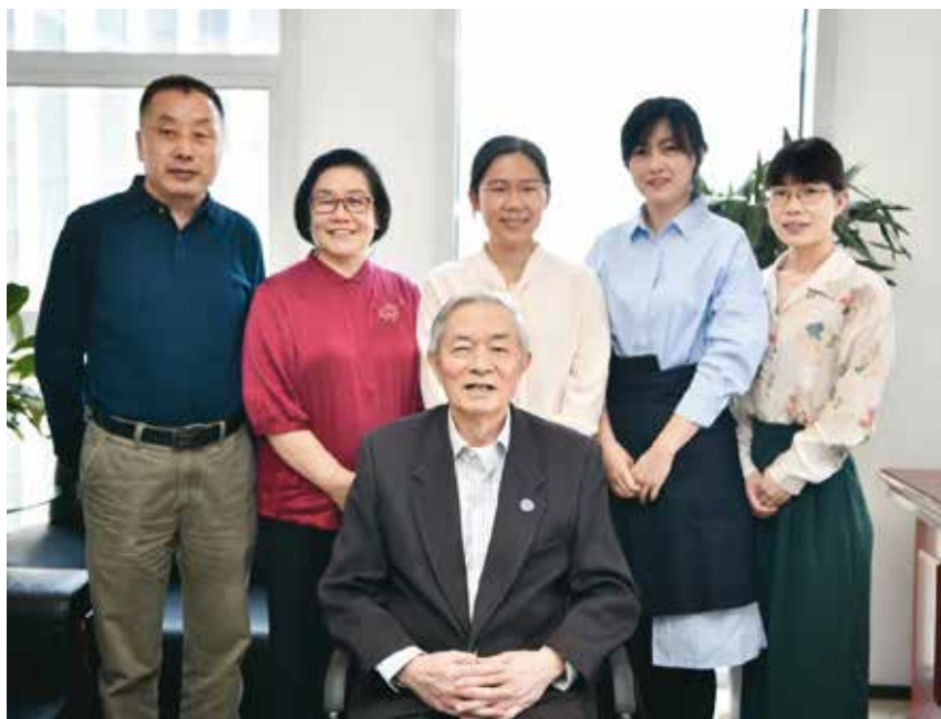
图1 吴澄院士接受学会秘书处采访