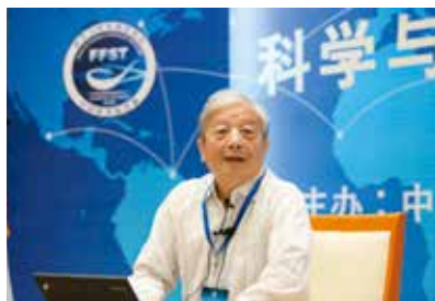
图 4 2013 年主持中科院学部以“控制科学面临的前沿科学与工程问题”为主题的科学与技术前沿论坛

2011 年中科院信息技术科学部常委会经认真研究认为应及时开展有关控制科学发展战略的研究，并认为这一重要任务依托北京大学并由黄琳院士主持完成是非常合适的。经过两年多努力先后组织了近百位华人一线教授积极参与完成了研究报告，并于