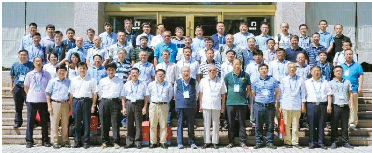
图1 2018中国智能自动化大会参会人员合影

60年砥砺前行， 60载铸就辉煌！ 展望未来，中国自动化学会智能自动化专业委员会祝愿中国自动化学会创新引领，再谱华章！