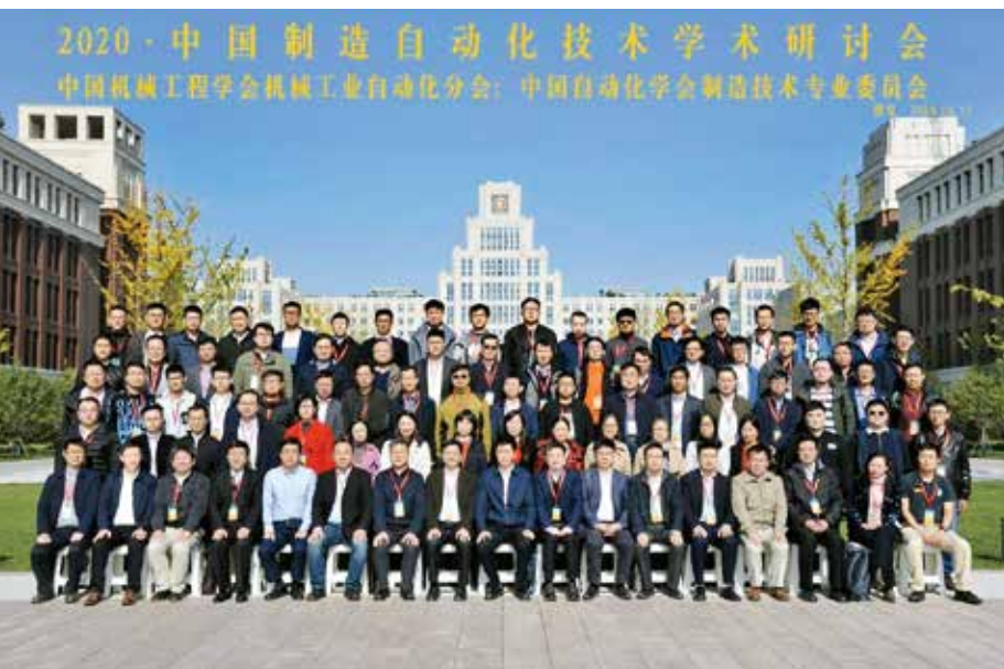
图2 与会代表在西安交大创新港合影留念