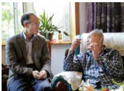
图1 2015年学会秘书长采访张嗣瀛院士（左为王飞跃）