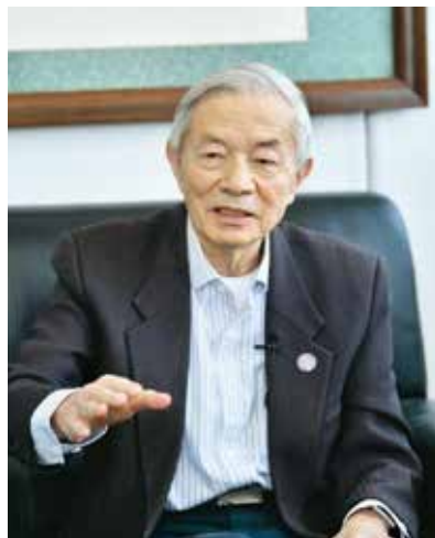
图2 吴澄院士寄语学会

吴澄认为中国要发展，经济要发展，科技要发展，特别是经济发展，离不开自动化。自动化的发展符合了我们国家快速发展、跨越发展的道路，今后将具有顽强的生命力。国家经济增长迅速，中间离不开大量的科技工作者的贡献，当然也包括了自动化科技工作者的贡献。自动化学科是一门交叉学科，现代人才培养尤其是自动化学科的人才培养要注重交叉学科培养，注重产教融合发