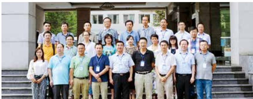
图1 专委会委员代表合影留念

经积极筹备，2015年8月30日“中国自动化学会认知计算与系统专业委员会成立大会”在成都成功召开。成立大会上顺利完成各项议程并选举产生专委