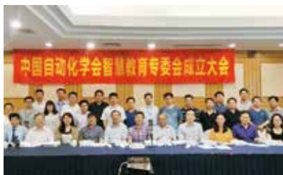
图1 专委会成立大会

2018年5月18日，“中国自动化学会智慧教育专业委员会成立大会”在江苏省会议中心召开，