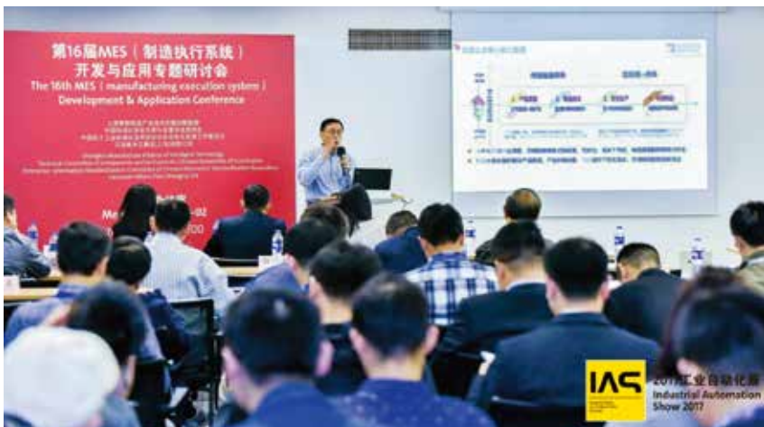
图3 第 16 届 MES（制造执行系统）开发与应用研讨会

来自国内的以亚控为代表的众多高科技技术创新企业与现场嘉宾共同探讨 MES 技术最新发展动态，为中国制造型企业成功升级为“智造型企业”建言献策此次会议主题报告深入剖析了工业 4.0、工业互联网、中国制造 2025 战略内涵，论述了智能制造需求、挑战、建设内容与成果，其中如 ABB 公司制造执行系统 CPM、亚控一体化全组态 MES 项目产品、具有 MES 的海立智能制造集成系统等在应用中取得的明显成效，凸显了 MES 在智能制造中的核心作用。○