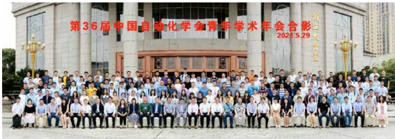
图1 第36届中国自动化学会青年学术年会（YAC 2021）

六十载，砥砺成钢，铸就英姿飒爽，沉淀深厚底蕴；六十载，自主创新、重点跨越、引领未来，凝聚大批有识之士；六十载，以“献身、创新、求实、协作”的精神为祖国培养了大批栋梁之才。在中国自动化学会六十华诞之年，中国自动化学会青年工作委员会祝愿学会在新的征程里，新的挑战中，再创佳绩，铸造新的辉煌！