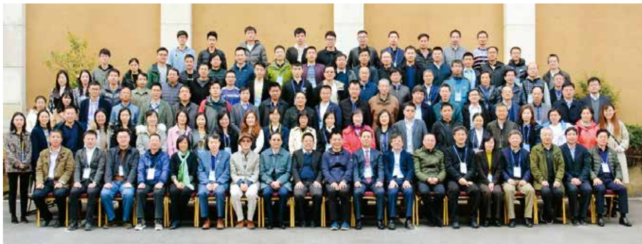
图1 中国自动化学会国防大数据专业委员会成立大会暨首届高峰论坛

2019年10月12—14日，由中国自动化学会国防大数据专委会组织召开的“第二届国防大数据高峰论坛”在浙江嘉兴举办。论坛邀请了等邬江兴院士、金亚秋院士、杨小牛院士、王沙飞院士、戴琼海院士、孙凝晖院士、吴枫教授、谢军研究员、孔令讲