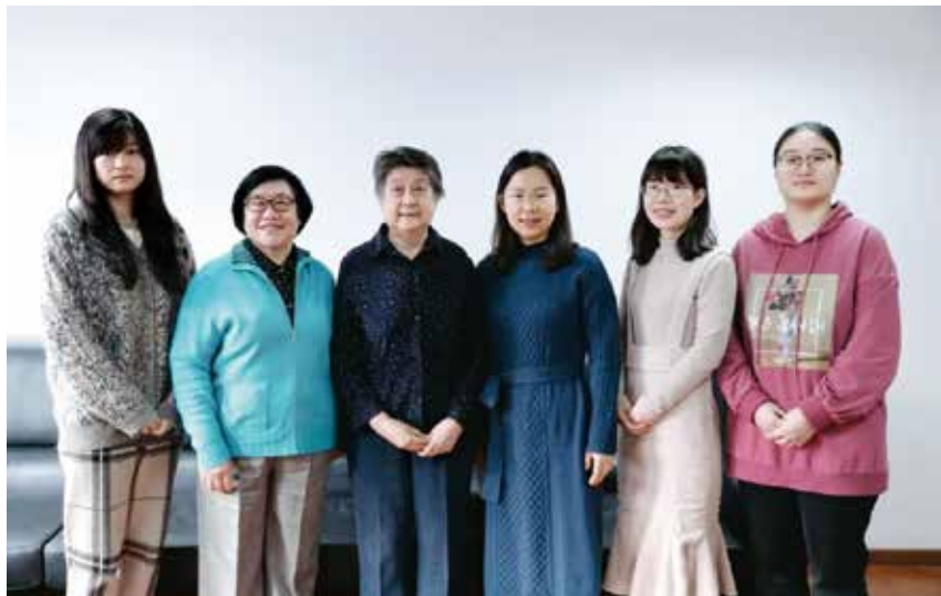
图3 胡启恒院士与秘书处人员合影

2021年是中国自动化学会成立六十周年，胡启恒作为学会第四届和第五届理事会理事长，对学会的工作表示了充分的肯定，认为目前学会已经成为自动化领域科技工作者的一个精神归宿，为产、学、研、用、服搭建了沟通的桥梁。面对未来，胡启恒希望学会能够继续担起社会重任，汇聚科学家群体，推动科技经济深度融合，助力领域科研发展，为中国未来发展贡献力量。○