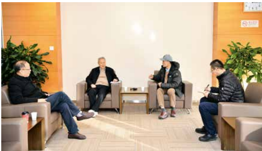
图6 李衍达院士语重心长寄语后人