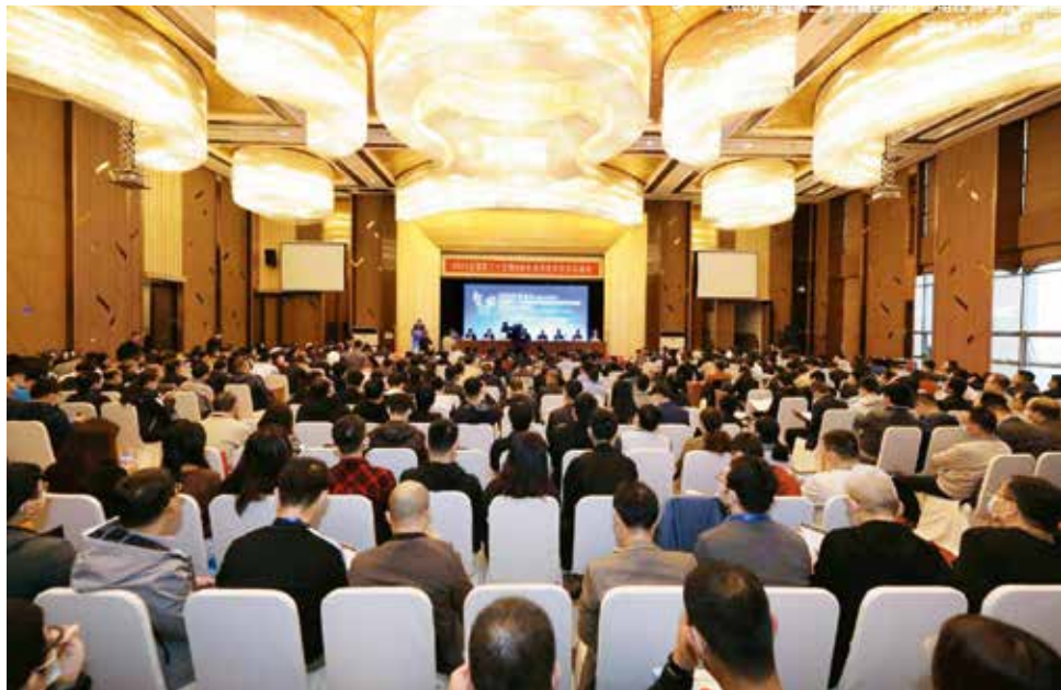
图1 2020全国第二十五届自动化应用技术学术交流会大会现场

为提升制造业技术创新能力，推进新一代自动化和信息技术发展应用，激发增强企业活力，专委会每年精心策划、周密筹备，邀请国内知名学者专家，围绕行业热点，服务行业科技发展和转型升级，分享展示最新研究、开发及应用成果，交流智能制造实践经验，在推进新一代自动化和信息技术发展应用、转型升级等方面，作出了积极的贡献。