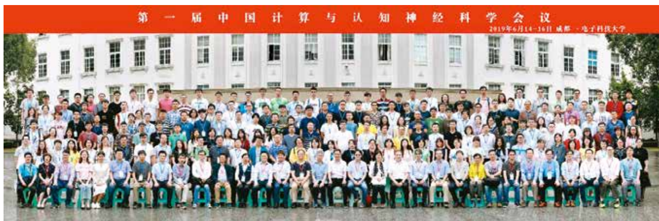
图1 第一届中国计算与认知神经科学会议

甲子华诞、峥嵘辉煌！中国自动化学会生物控制论与生物医学工程专业委员会祝愿中国自动化学会蒸蒸日上，竿头日进，为自动化学科，为国家科学技术发展作出新的更大贡献！