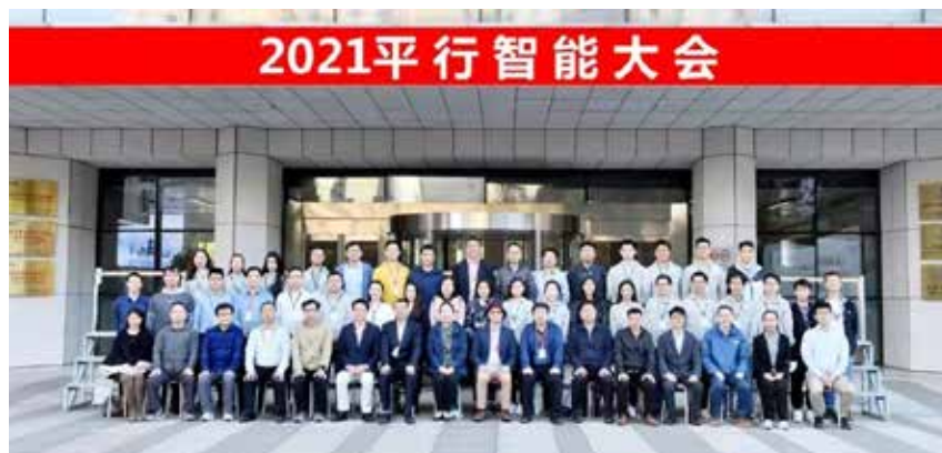
图4 2021年平行智能大会合影

2021年10月15日—16日，复杂系统管理与控制国家重点实验室联合中国自动化学会等单位主办，中国自动化学会系统复杂性专业委员会参与协办的以“平行智能推动智能科学与技术创新”为主题的2021年平行智能大会在北京中国科学院自动化研究所顺利召开。