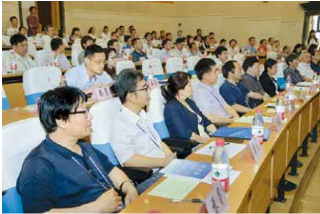
图1 中国自动化学会数据驱动控制、学习与优化专业委员会成立大会