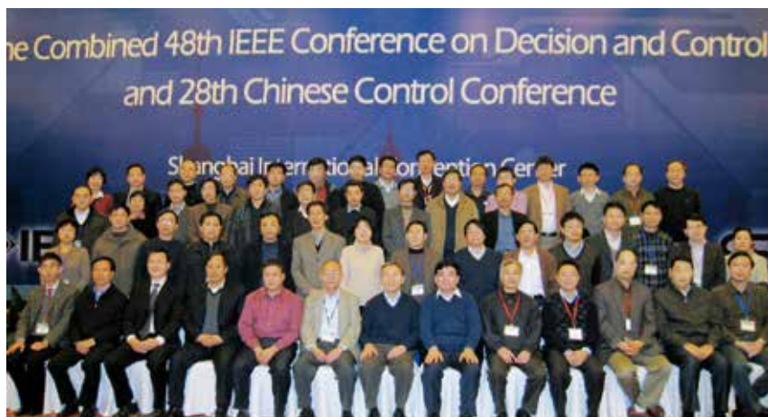
图1 参加会议的专委会委员、顾问合影

六十年风华正茂，六十年砥砺前行，中国自动化学会控制理论专业委员会祝愿中国自动化学会青春常驻，再续辉煌!