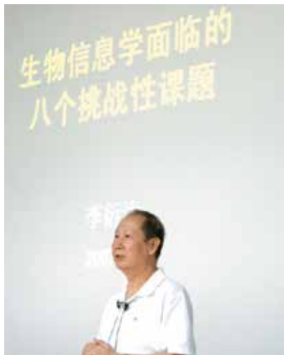
图5 2007年8月23日李衍达在生物信息学全国研究生暑期学校上做结业典礼报告

李衍达在美国的学习经历让他认识到信息对一个国家的重要性，“一个国家没有信息是不行的，它相当一个国家的神经，信息系统相当人体的一个神经系统，人体光有肌肉、光有大脑是不够的，还要有神经系统”。而在这时又恰逢国外传来要搞信息高速公路的消息，这马上触动了李衍达的神