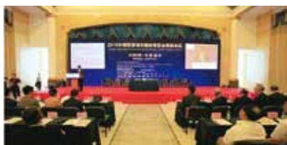
图1 2015中国智慧城市国际博览会高峰论坛在京召开

工委作为国家基于新型智慧城市、新型城镇化及智慧产业咨询规划、监督评价与公共服务的第三方组织，以科技创新为指导，以智慧城市、新型城镇化建设为目标，以生态环境保护、科技成果转化、智慧产业与民生服务为重点，旨在践行国家战略，促进和推动我国经济转型升级与科学发展，为政府、理事会成员、企事业单位、高校、科研机构、行业、城市、城镇及社区提供高效优质服务。