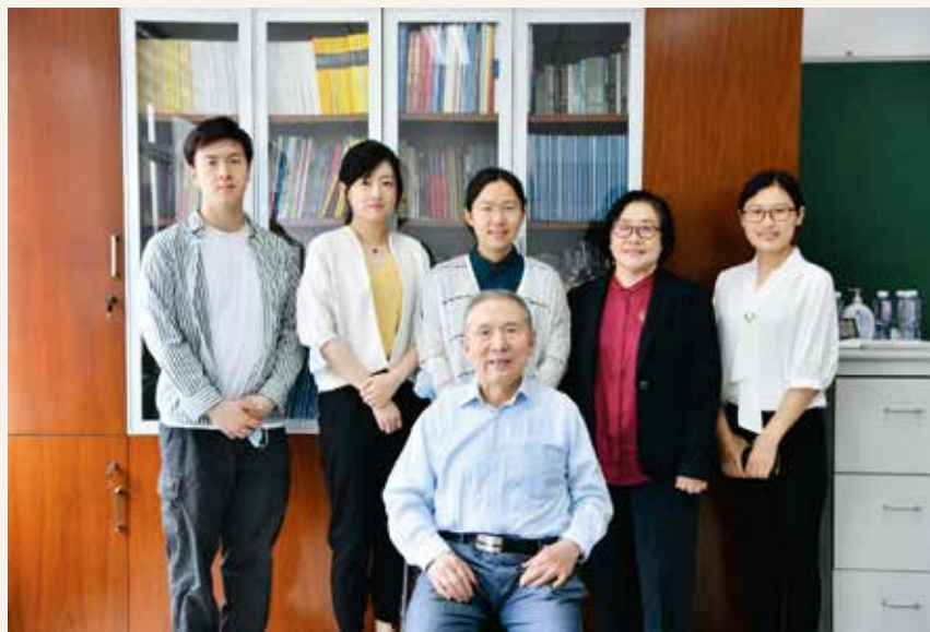
图1 陈翰馥院士接受学会秘书处采访

1995年自适应控制领域的“最重要论文”之一。他和合作者提出扩展截尾的随机逼近算法解决了许多系统辨识和适应控制问题。他与其学生给出了自校正跟踪器收敛性和最优性的严格证明，被国际控制界称为“重大突破”。他是新中国少数在国际学术界产生重大影响的学者之一。