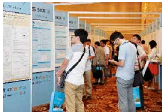
图2 第34届中国控制会议和日本仪器与控制工程师学会2015年会

2019年12月15日晚召开了“控制理论专业委员会工作会议”，参加会议的委员达53人。会上汇报了专委会一年来的工作，介绍了第29届中国控制会议的筹备进