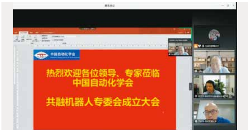
图1 中国自动化学会共融机器人专业委员会成立大会

2020年7月23日，“中国自动化学会共融机器人专业委员会成立大会”通过网络会议形式成