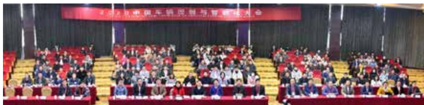
图1 第四届中国车辆控制与智能化大会

2018年9月19—22日，“第五届IFAC E-CoSM国际学术会议”在长春召开，由专委会及吉林大学汽车仿真与控制国家重点实验室承办。IFAC E-CoSM会议始创于2006年，