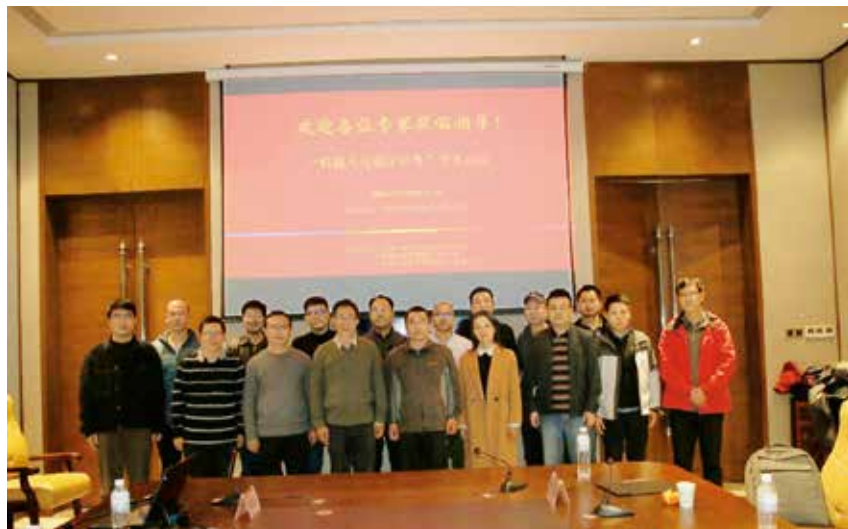
图2 机器人与极区科考学术论坛

术与应用论坛”,论坛反响热烈,在线高峰人数千余人次,互动交流信息百余条。多位专家结合国内外的发展趋势,深入探讨跨域多机器人技术如何有机协调、跨域协作,并展示领域内最新应用成果,充分利用跨域多机器人的功能互补性,组成跨域协作系统,实现信息共享和行为协同,