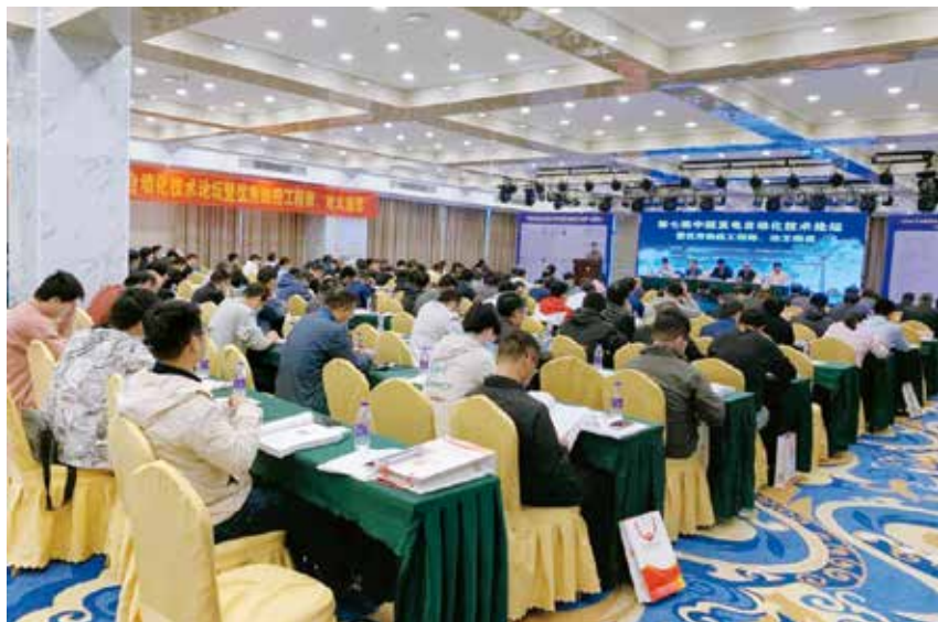
图 1 2020 年中国发电自动化技术论坛现场