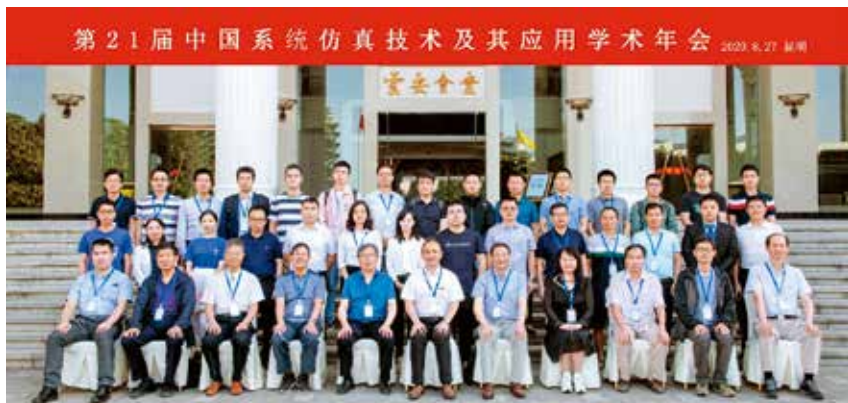
图1 2020年度第二十一届中国系统仿真技术及其应用学术年会

国系统仿真学术年会”，后改名为中国系统仿真技术及其应用学术年会。“仿真科学与技术”已成为人类认识与改造客观世界的重要方法手段，并且随着和人工智能技术的逐步融合，必将在关系国家实力和安全的国防及国民经济等关键领域发挥越来越重要的作用。中国系统仿真技术及其应用学术年会无疑对我国系统仿真科学与技术的发展起到积极的促进作用。○