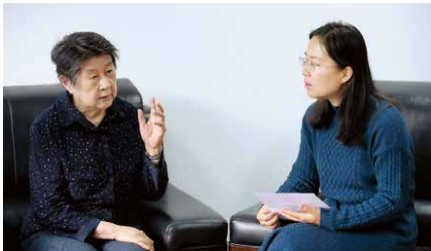
图1 胡启恒院士接受学会秘书处采访

此外，她还推动了互联网在中国的发展，不仅促使中国实现与国际互联网的全功能连接，将互联网带进了中国，而且在国内大力发展互联网服务，建立了以