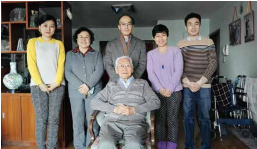
图2 我国自动化科学技术开拓者 陆元九

为日后深造打下了坚实的基础。毕业后，陆元九留校任助教，他广泛接触航空工程领域，为提高夯实理论基础有着重要意义。