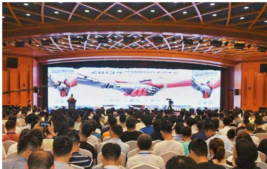
图1 2019年中国机器人学术年会

2020年11月13—15日,专委会联合主办了“机器人与极区科考学术论坛”,论坛面向极区科考的重大任务需求,针对机器人与极区科考任务高效结合所面临的基础理论研究、核心技术攻关、关键装备研制等开展交流与研讨,促进学科融合,助力极区科考。○