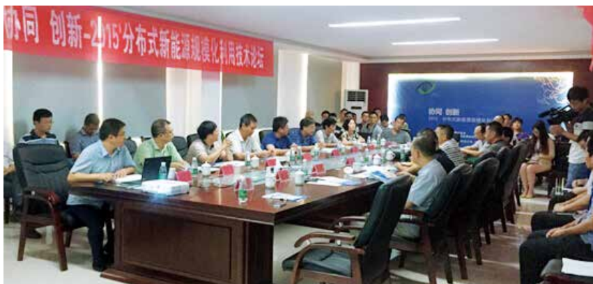
图1 协同创新-2015分布式新能源规模化利用技术论坛

专委会自成立之初便与江西仪能新能源微电网协同创新有限公司保持密切的合作关系，致力