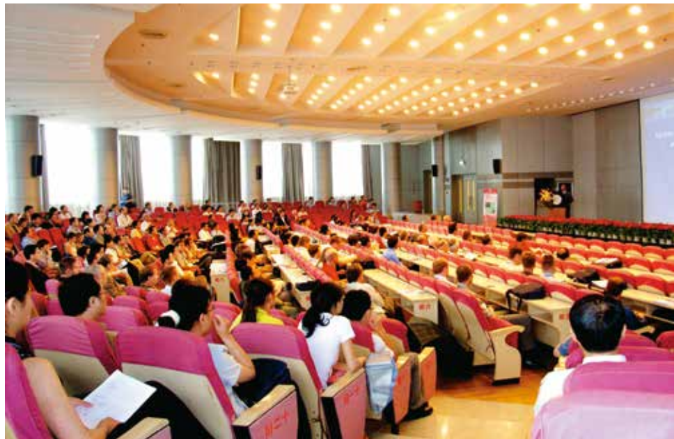
图1 IFAC SAFEPROCESS会场

此外，2006年8月，我国成功承办了第六届IFAC技术过程的故障检测、监控与安全性国际会议（IFAC Safeprocess），这是我国在这一领域的研究在国际上影响力的具体体现。这其中，中国自动化学会技术过程的故障诊断与安全性专业委员会起到了重要的推动与引导作用。