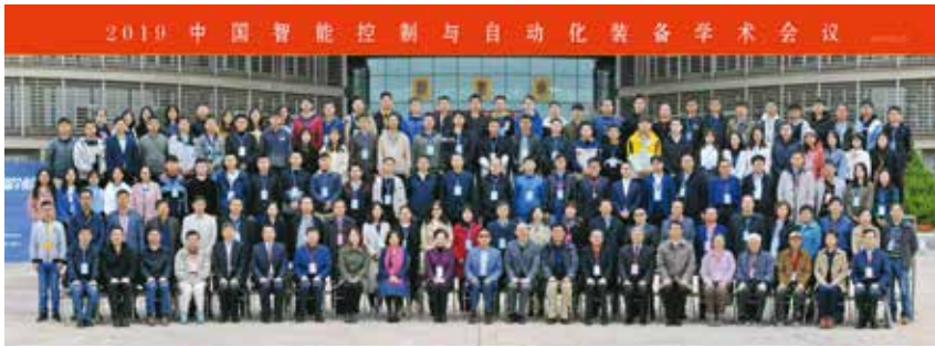
图2 2019 中国智能控制与自动化装备学术会议