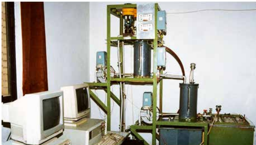
图4 冷热水混合器实验装置用作2-输入，2-输出大系统的被控对象

万百五先生及其课题组长期致力于工程、社会、经济、组织（企业、工厂、机关）等各类大系统的建模、协调、优化、决策、管理、智能控制和产品质量控制等理论和应用的研究。他们