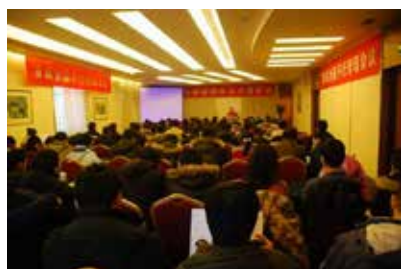
图1 首届全国平行控制会议大会现场

2009年12月20日至21日，由中国自动化学会系统复杂性专业委员会主办的首届全国平行控制会议在北京友谊宾馆召开，同期召开的还有首届全国社会计算会议和首届全国平行管理会议。