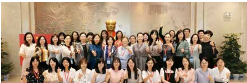
图1 2019中国机器人大赛

工委会的宗旨是通过组织机器人比赛和技术研讨，让更多的群众尤其是青少年了解机器人，喜爱机器人，向他们普及现代科学知识，为我国的机器人事业培养更多的优秀人才。同时通过机器人比赛和技术研讨，也为推动和促进机器人与自动化技术的发展与创新，以机器人、智能制造的产业引导及优秀人才选拔为契机，籍此实施新旧动能转换、互联网+智能制造的窗口效应。同时紧随国家智能制造战略，匹配城市产业发展的信息化、智能化打造窗口效应，为我国的快速持续发展贡献力量。