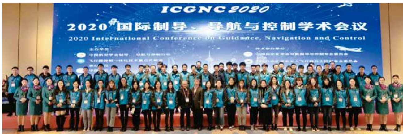
图1 2020国际制导、导航与控制学术会议

六十年弹指一挥间，六十年光辉岁月，恭喜中国自动化学会迎来六十岁的生日，中国自动化学会导航制导与控制专业委员会衷心祝愿学会越办越好！