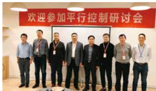
图 1 2019 年第 11 届全国平行控制会议暨中国自动化学会平行控制与管理专业委员会工作会议

专委会自成立以来，连续组织开展“全国平行控制会议”和“全国平行管理会议”为主的学术活动，会议的规模逐年扩大，会