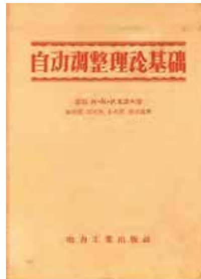
图3 前苏联阿·阿·伏龙诺夫.《自动调整理论基础》（中译本）

随着我国经济发展和社会进步，这门课程在高校所授予的群体也越来越广泛，逐渐成为一门技术基础性课程。不仅仅包括自动化、计算机学科、控制学科，还包括机电类、管理科学、经济金融学、航空航天、生态、生理